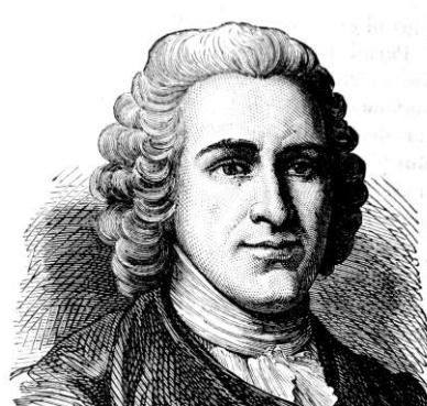
Жан-Жак Руссо 1712-1778