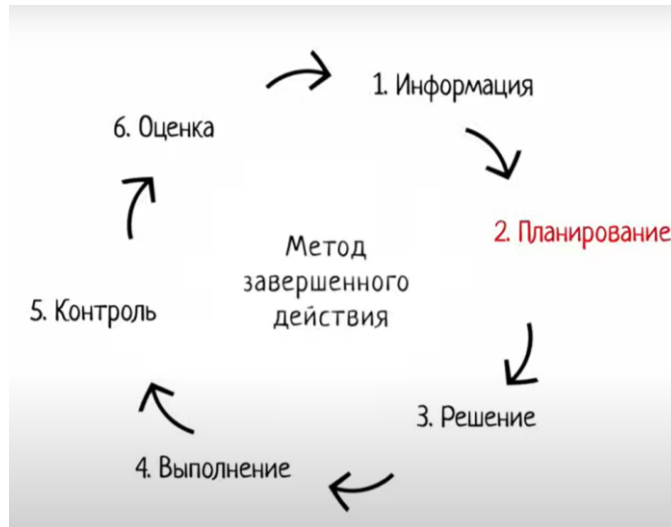
Немецкая дуальная система