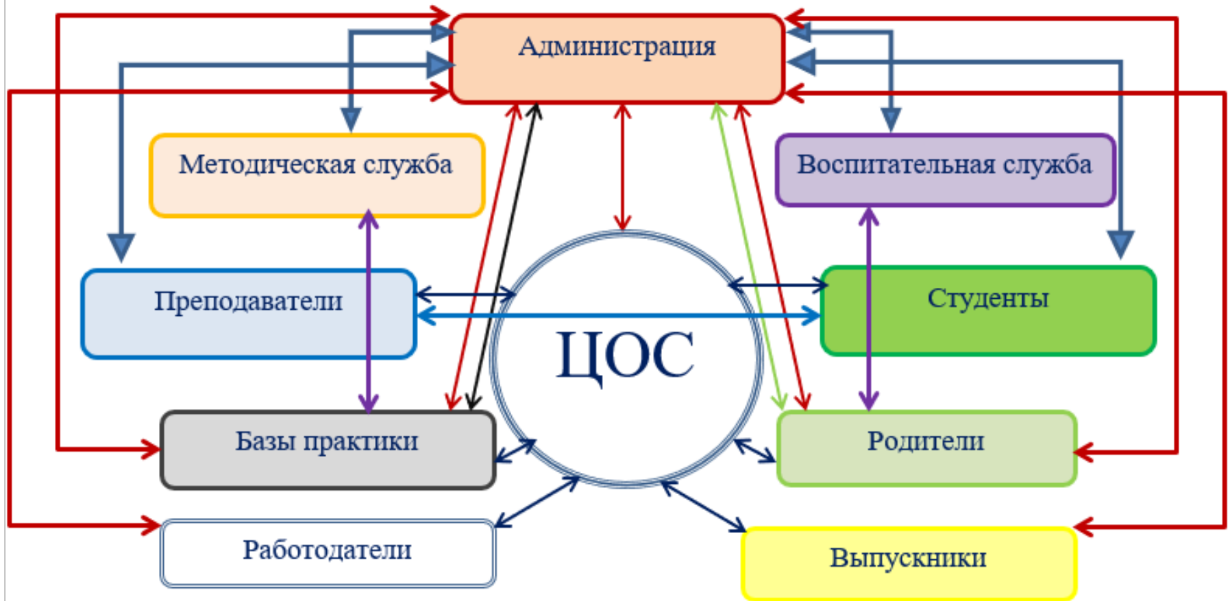
Схема коммуникационных связей